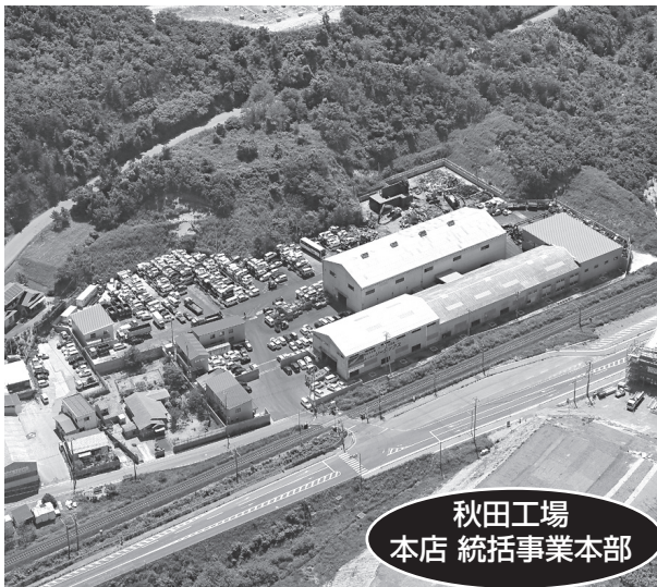
秋田工場 本店 統括事業本部