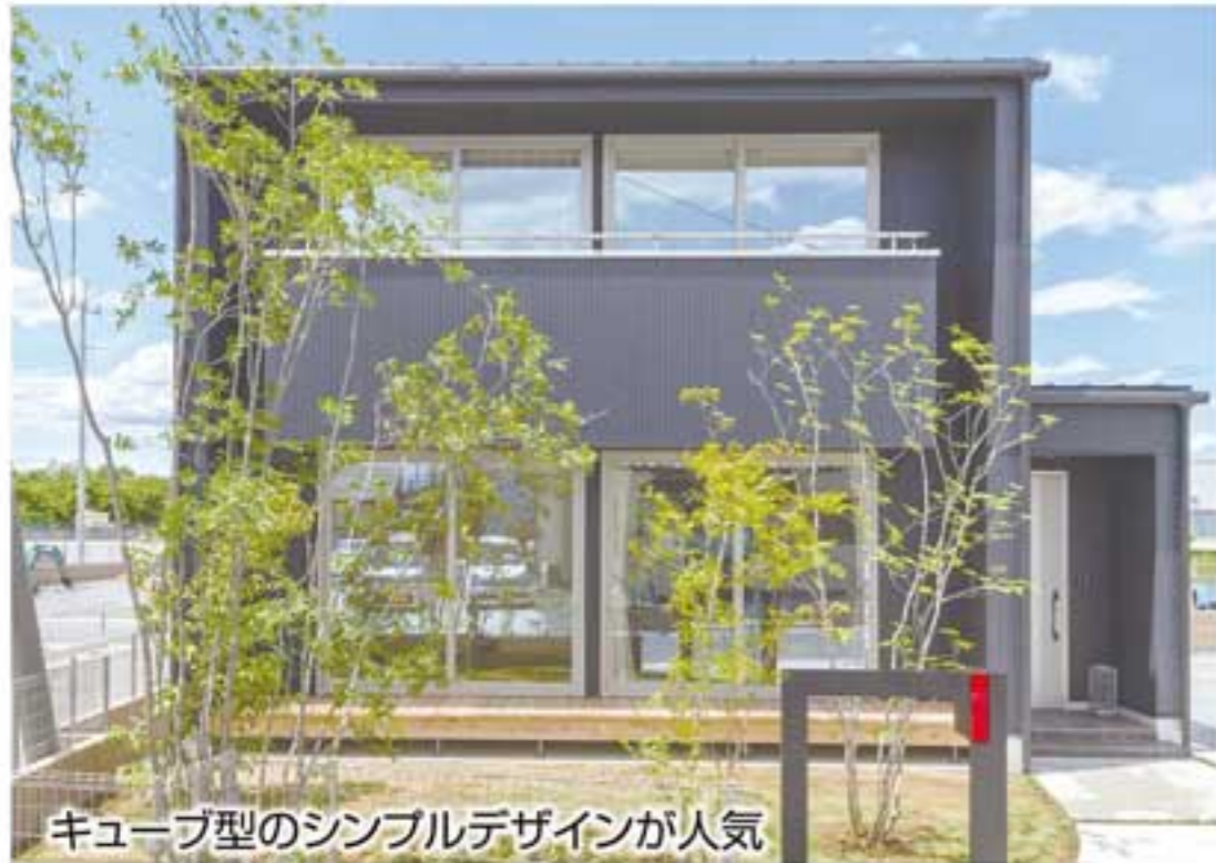
キューブ型のシンプルデザインが人気