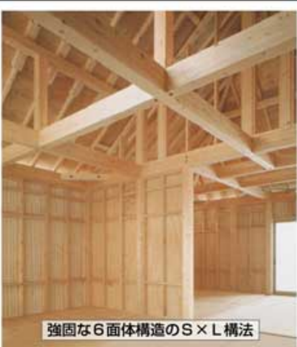
強固な6面体構造のS×L構法

秋田市八橋・臨海バイパス沿いのヤマダ電機（テックランド秋田本店）の一角に建つモダンなたたずまいのモデルハウス。それが、ヤマダ・エスバイエルホーム「テックランド秋田展示場」。国内で最も長い歴史を持つ住宅メーカーとして培ってきたSXLの設計・施工技術を秋田で唯一、直に体感できる展示場です。魅力いっぱいの空間で、理想のマイホームづくりのヒントになる新たな出会いを探して見ませんか？