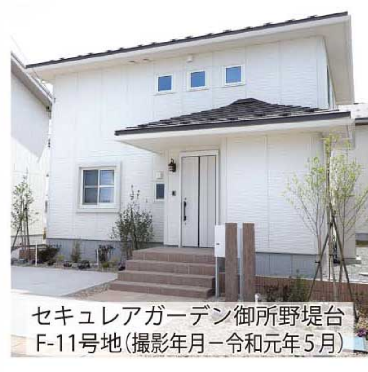
セキュリアガーデン御所野堤台F-11号地(撮影年月=令和元年5月)