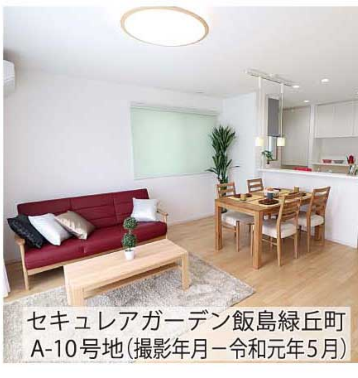
セキュリアガーデン飯島緑丘町A-10号地(撮影年月=令和元年5月)