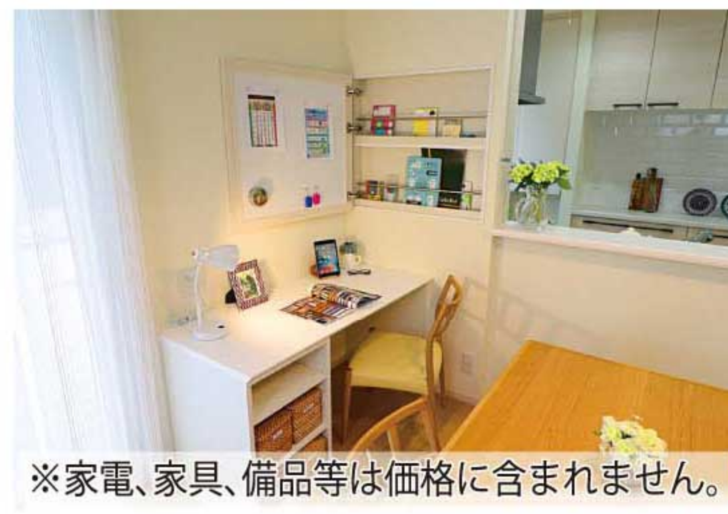
※家電、家具、備品等は価格に含まれません。

セキュリアガーデン飯島緑丘町A-1号地、御所野堤台F-12号地は、「家事を楽しもう。家族を楽しもう」がコンセプトの「家事シェアハウス」。家事を「家族みんなのこと」と考え、みんなで自然に家事をシェアできるよう工夫。「自分専用カタツケロッカー」「お便り紙蔵庫」「ビューティークローゼット」などを備え、家事に対する気持ちの負担を軽減できる環境に満ちています。