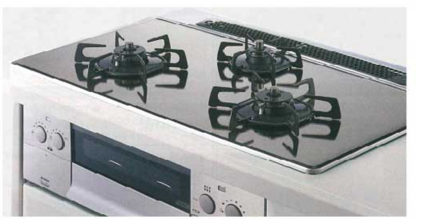
ビルトイン自動調理対応コンロ