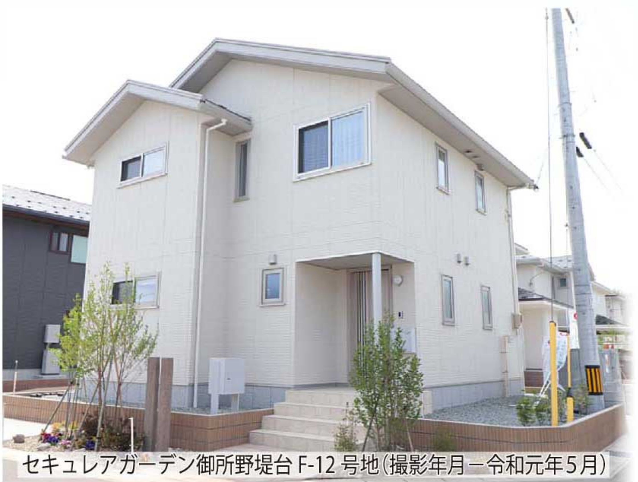
セキュリアガーデン御所野堤台F-12号地(撮影年月=令和元年5月)

セキュリアガーデン飯島緑丘町A-1号地、御所野堤台F-12号地は、「家事を楽しもう。家族を楽しもう」がコンセプトの「家事シェアハウス」。家事を「家族みんなのこと」と考え、みんなで自然に家事をシェアできるよう工夫。「自分専用カタツケロッカー」「お便り紙蔵庫」「ビューティークローゼット」などを備え、家事に対する気持ちの負担を軽減できる環境に満ちています。