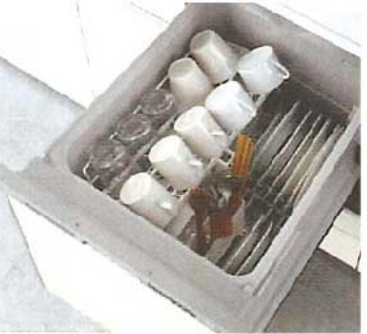
ビルトイン食器洗機

水まわりをリフォームする際に、トイレを節水型トイレに交換したり、お風呂を高断熱浴槽に交換すれば、様々な商品と交換できるポイントがもらえる「次世代住宅ポイント制度」が、このほど始まりました。水まわり関係のリフォームでは、エコ住宅設備や家事負担の軽減につながる設備を設置する工事が対象となります。対象工事を確認しておトクに活用しましょう。