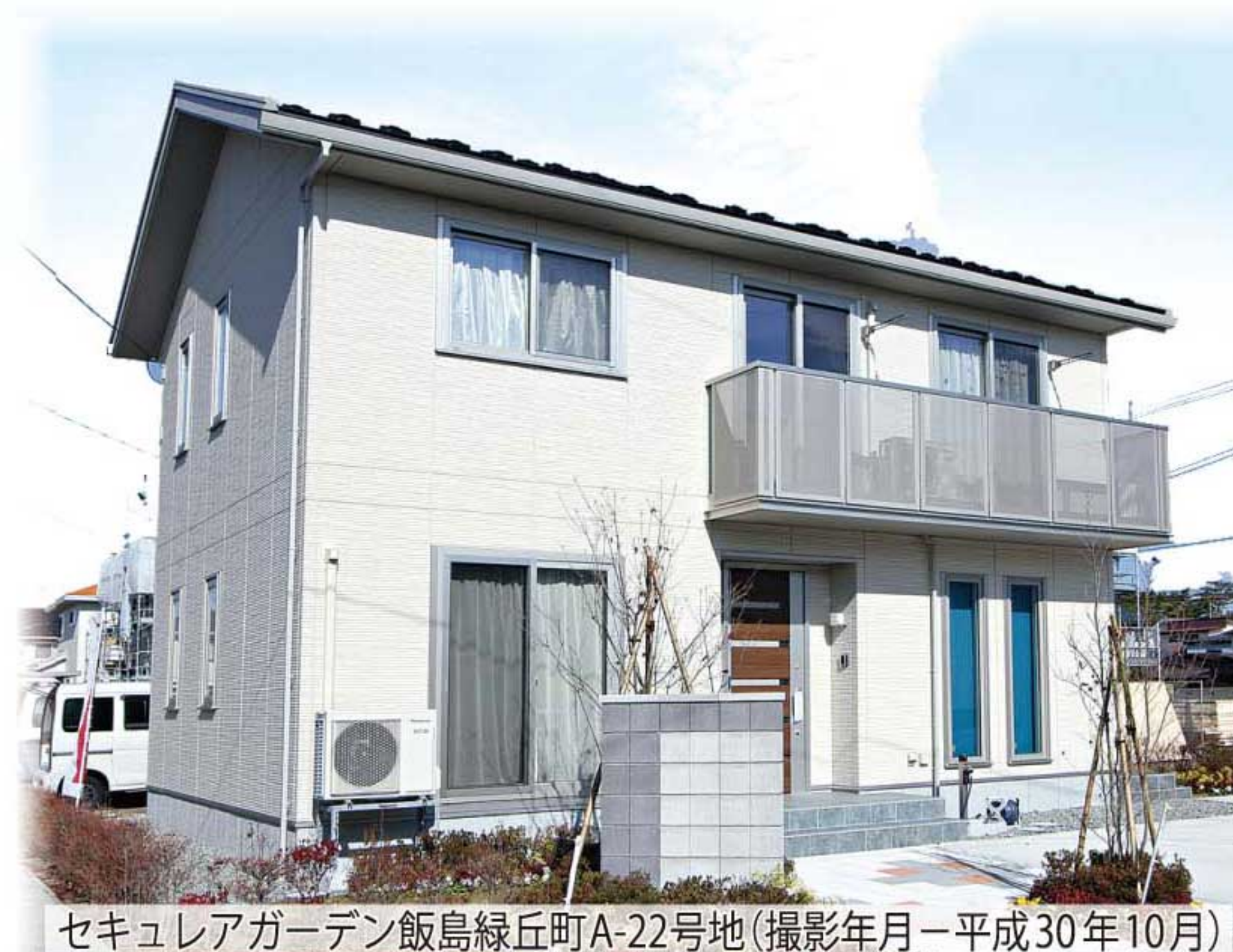
セキュリアガーデン飯島緑丘町A-22号地(撮影年月=平成30年10月)