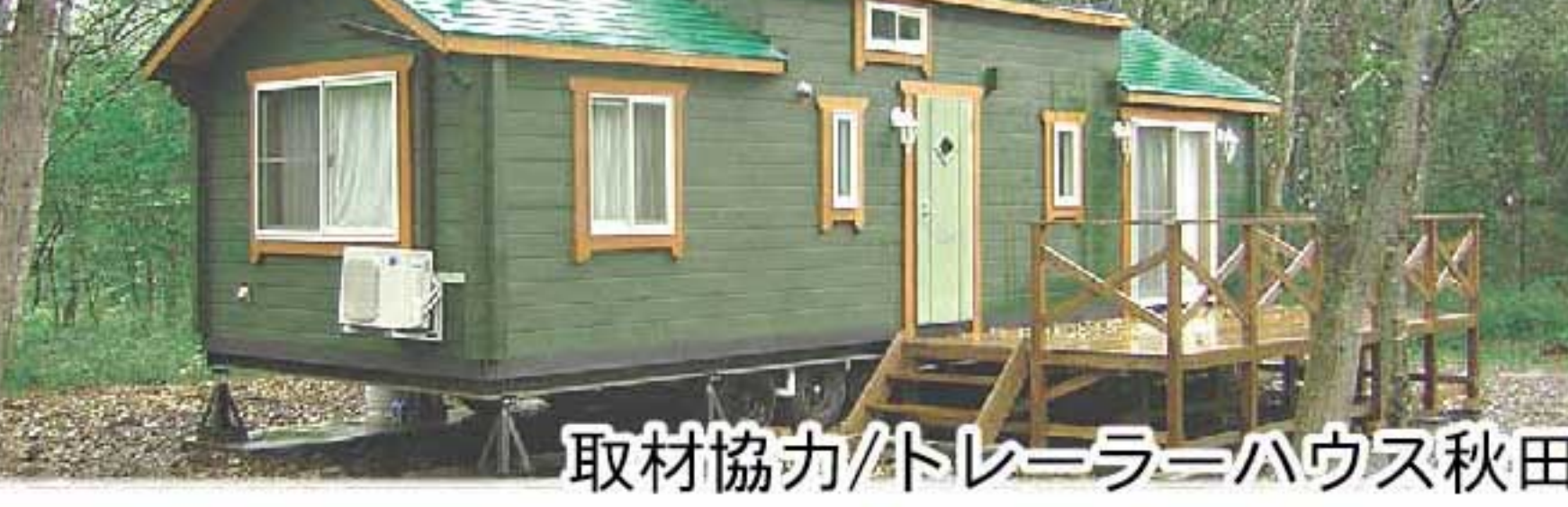
取材協力/トレーラーハウス秋田

移動できる高性能の店舗・住居として今注目されているトレーラーハウスは、従来のライフスタイルを変えます。