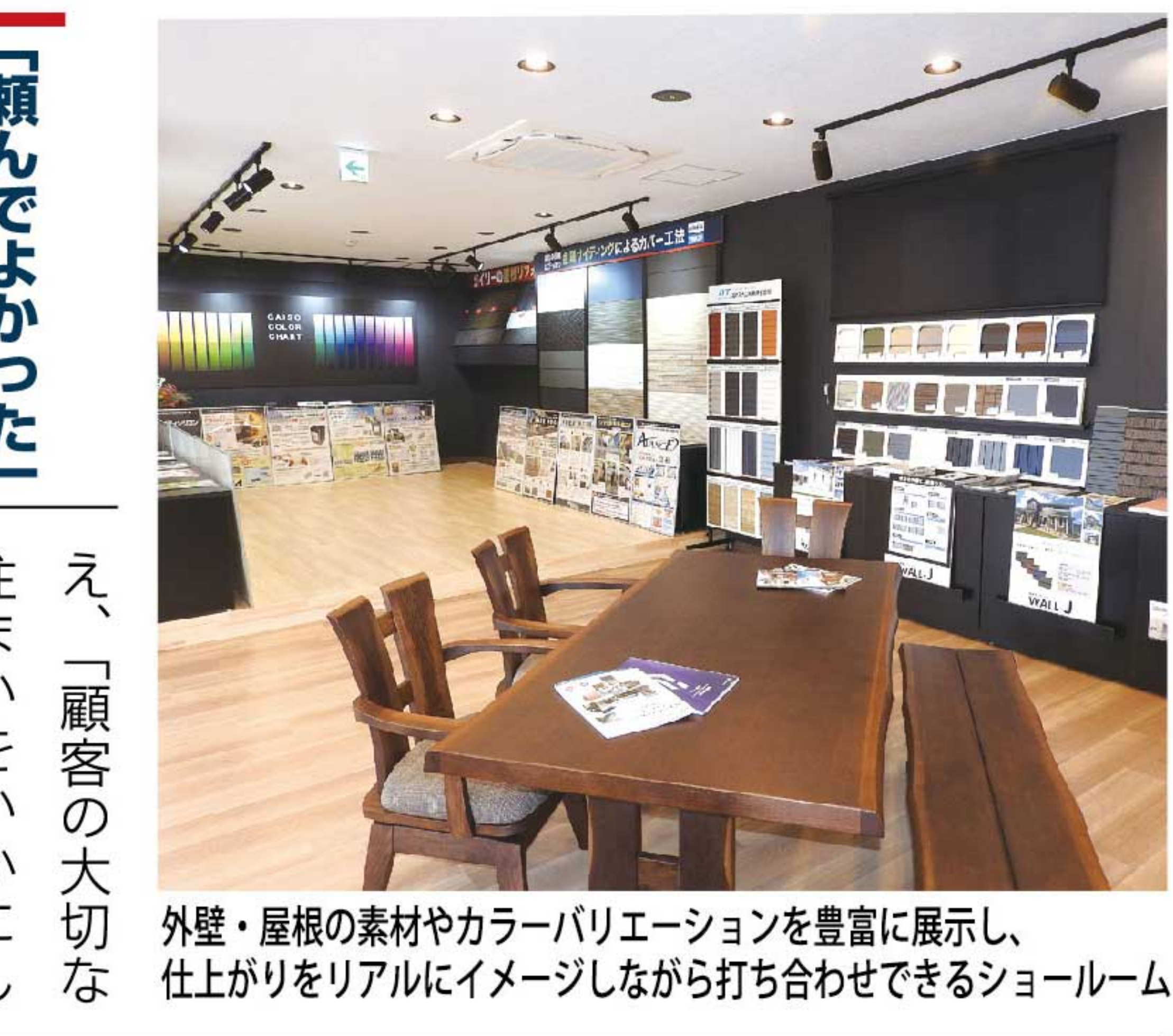
外壁・屋根の素材やカラーバリエーションを豊富に展示し、仕上がりリアルにイメージしながら打ち合わせできるショールーム

「手塗りローラー工法3回塗り」と「バイオ高圧洗浄」が2本柱（ともに標準仕様）。見えない場所だからこそ手を抜かないのが、ガイソーの流儀だ。