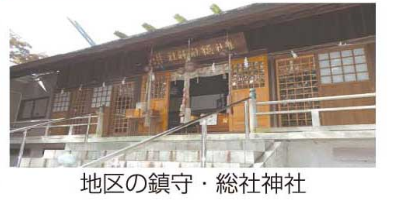
地区の鎮守・総社神社

東に住宅地、西に工業地帯。 秋田市川尻地区は、国道13号東側の住宅地（総社町・みよし町・上野町など）と旧雄物川沿いの臨海工業地帯（若葉町、川尻町字大川反など）から成る。歴史をひもとくと、かつては千秋公園や官庁街の山王地区、旭南・榎山の一部まで「川尻村」で、「川尻」は広いエリアだった。