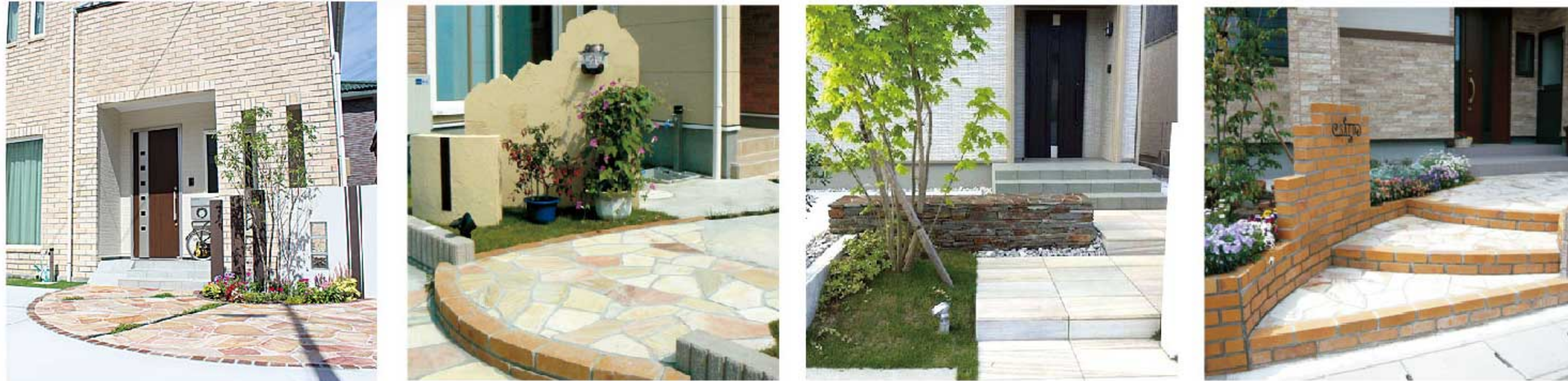
スッキリとしたデザインで広々空間