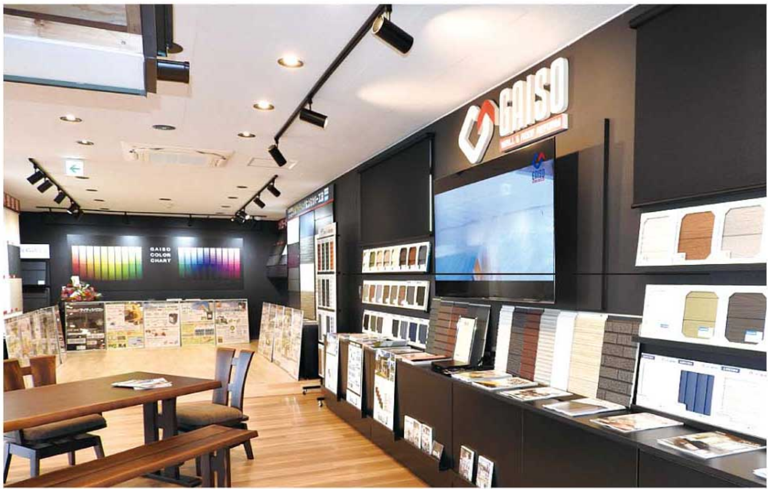
国道13号沿い・秋田市卸町の店舗内のショールームでは、多彩なカラーバリエーションや素材の見本をリアルに体感しながら打合せできます。

外壁・屋根のごとなら、どんな小さな工事でもお気軽にご相談ください。 ガイソーは、スピード対応をお約束いたします。