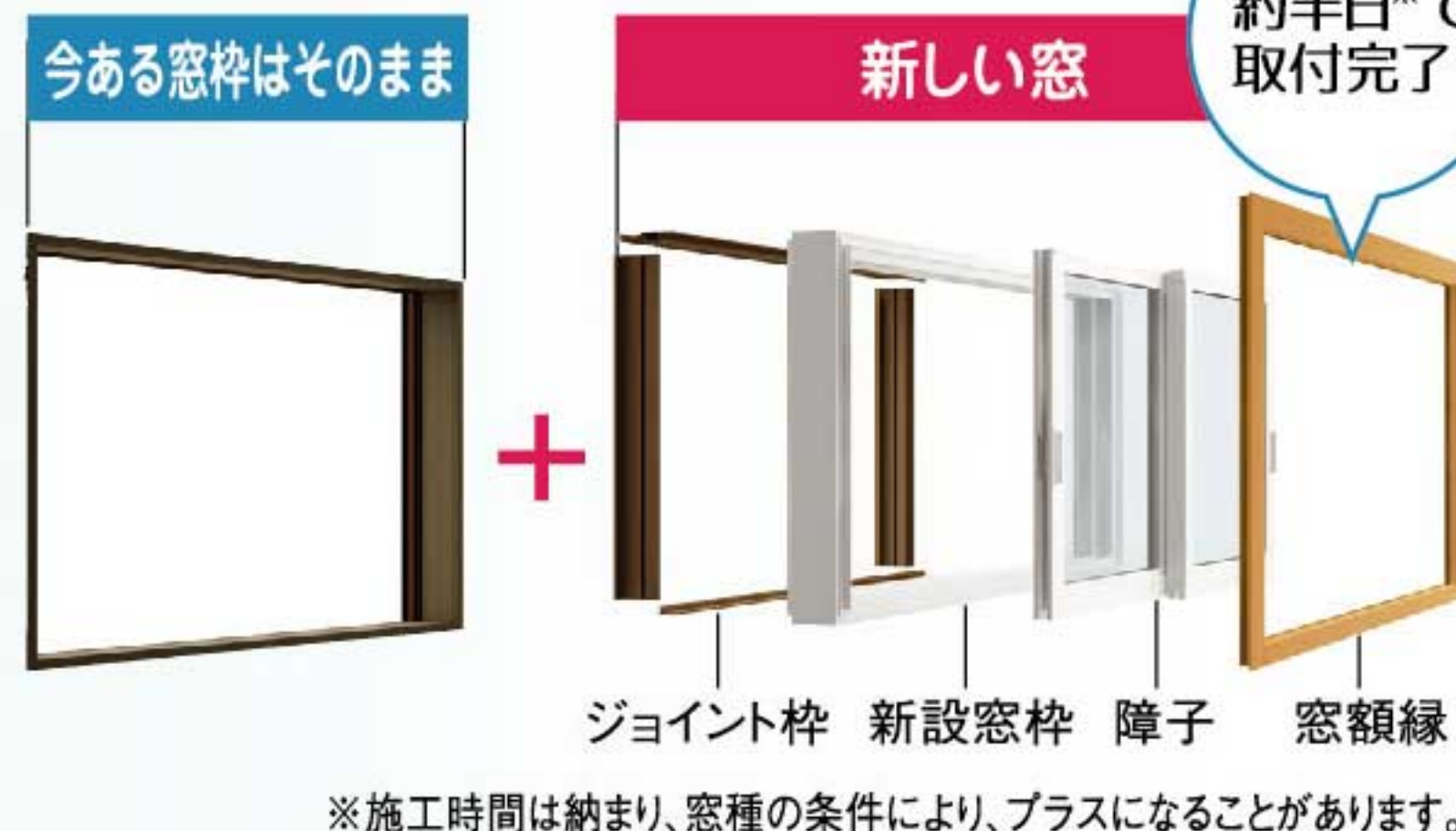
取材協力/YKK AP (株)

はそのままで、上から新しい窓をかぶせるだけの簡単な工法もあり、これなら約半日で取りつけが完了。壁の工事は不要で、最大1000倍、熱が伝わりにくくなります。