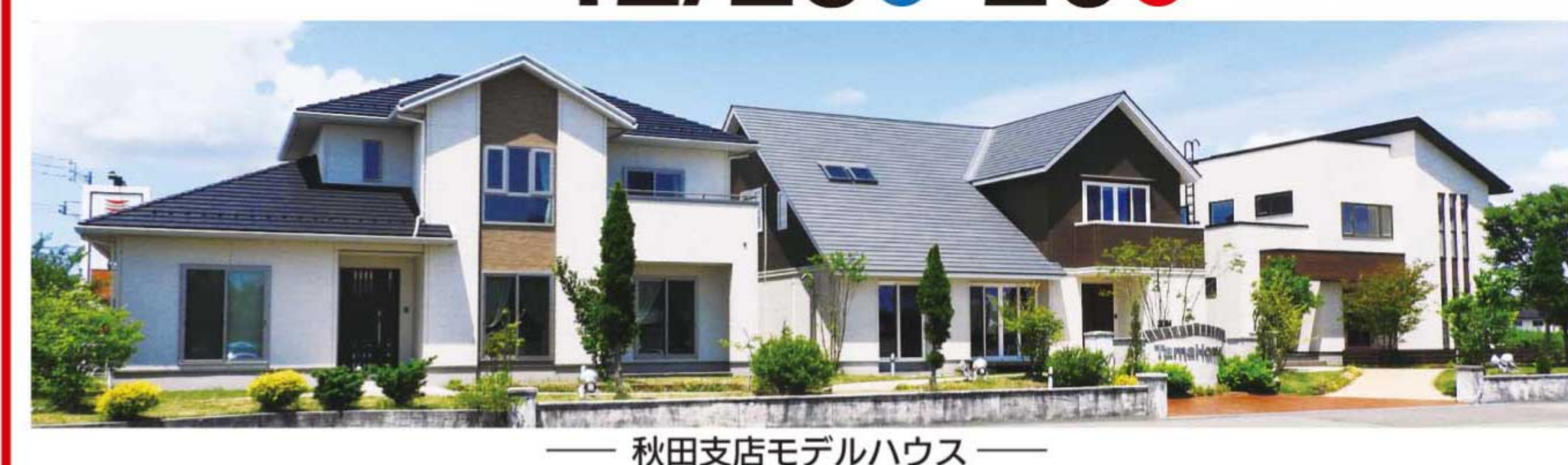
秋田支店モデルハウス