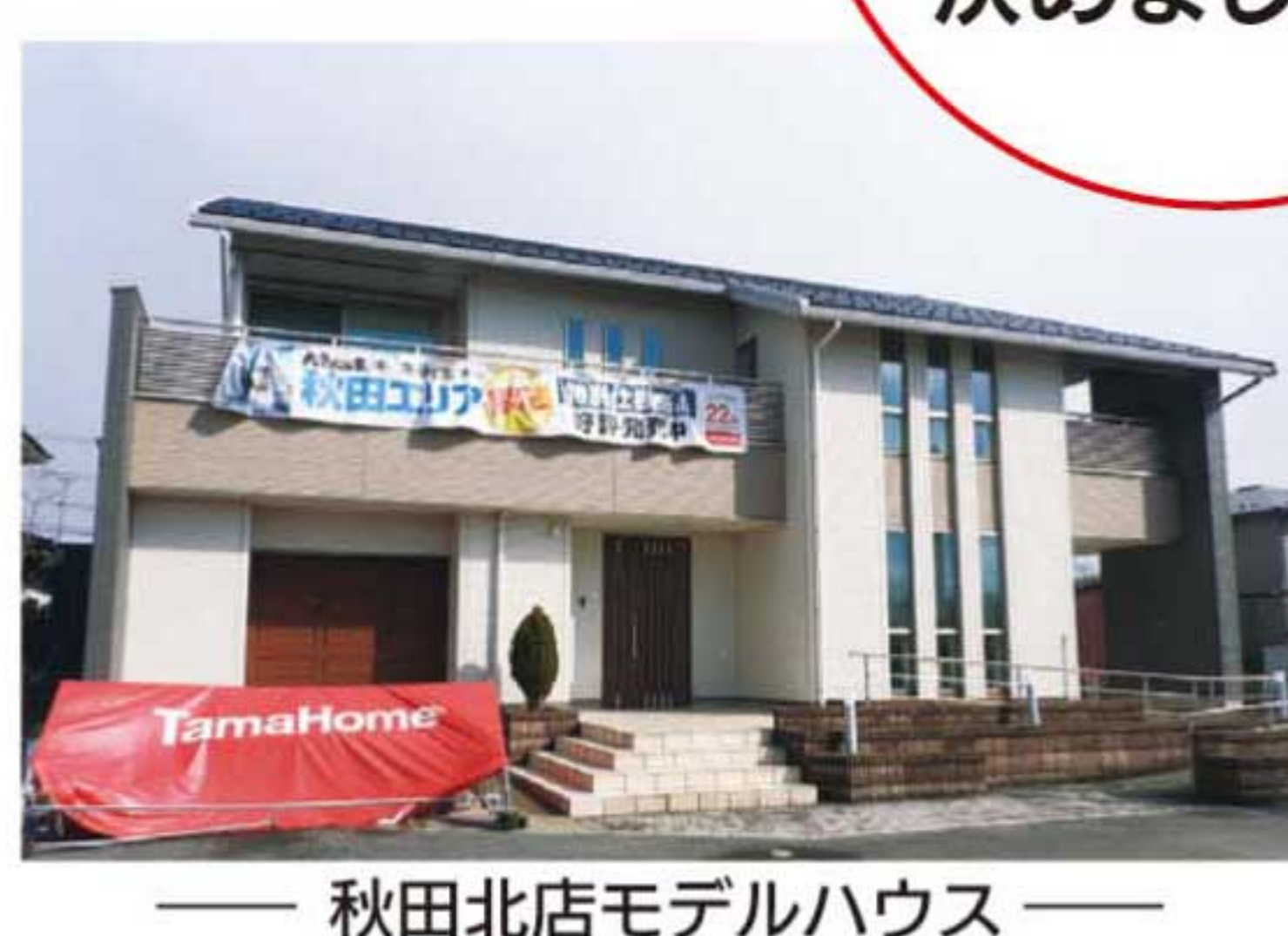
秋田北店モデルハウス