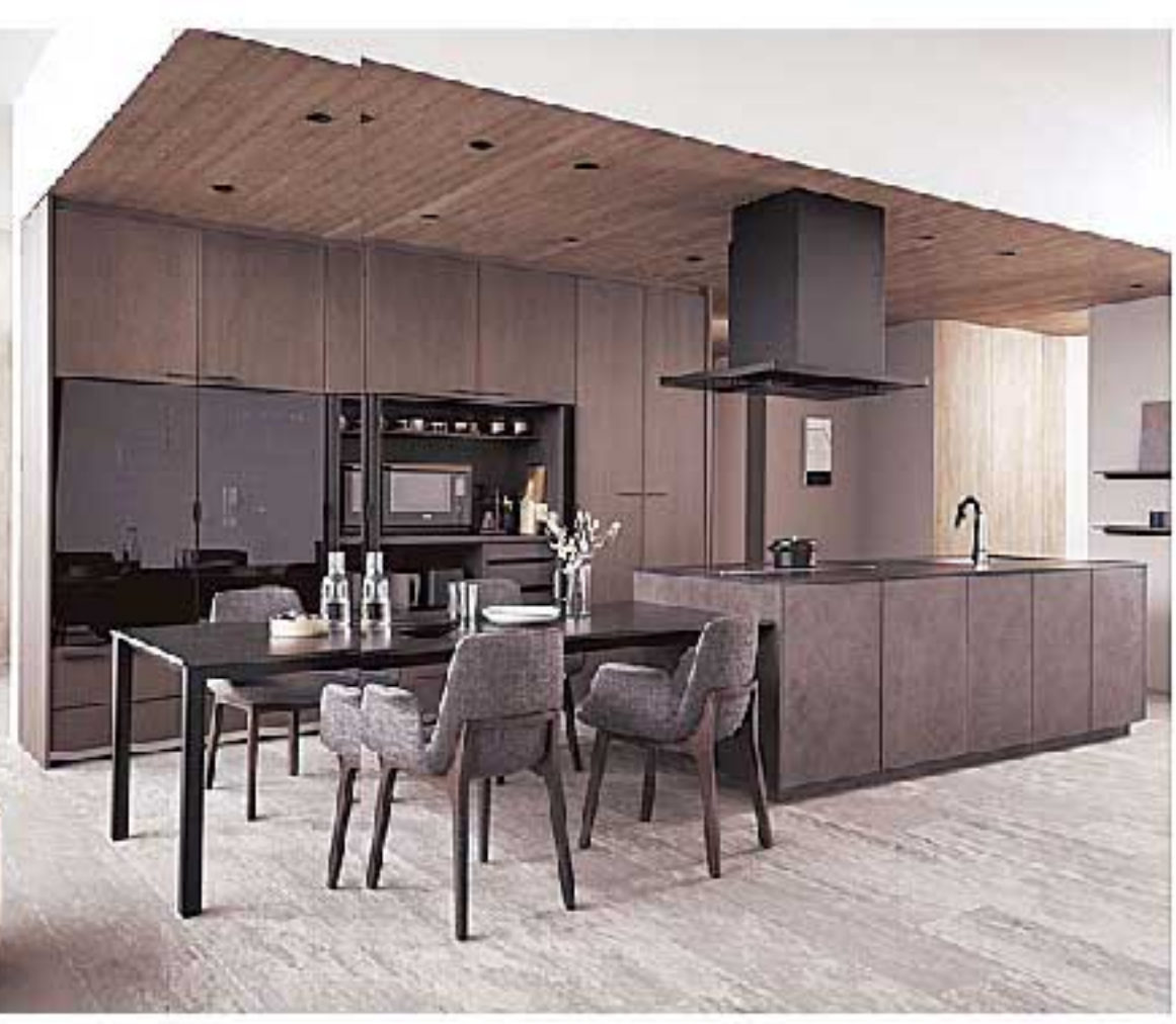
ダイニングキッチン (パナソニック「Lクラスキッチン」)

近年の住まいは、「L」「D」「K」をひとつの空間に納め、限られた面積をより広く使う「LDK」スタイルが主流ですが、それでも「L」「D」「K」には本来、それぞれの役割があり、そこでの過ごし方も違います。それぞれの空間の分け方(ゾーニング)は、「専用の居間や食堂がほしいか?」「来客が多いか?」など、家族の「プライベート」と「パブリック」の考え方がカギになります。