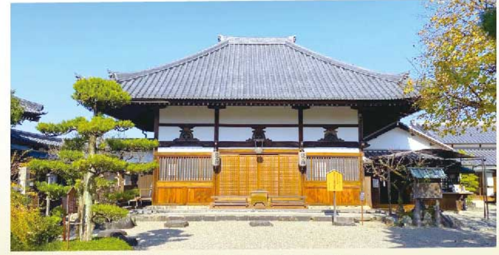
飛鳥寺(奈良県明日香村)

『日本書紀』によると、瓦が日本に伝来したのは6世紀(飛鳥時代)、仏教が伝来した588年頃とされる。時の権力者・蘇我馬子が初めて建立した仏教寺院(飛鳥寺)に瓦が使用され、これが日本で初めて瓦で屋根を葺いた建物と言われている。 これ以降、寺院の屋根は瓦に変わり、宮殿や城郭などの建築にも瓦屋根が使われるようになっていった。初期の瓦は「平瓦」とそのつなぎ目を覆う「丸瓦」で構成されたもので、古い寺院では現在もこの形の瓦屋根が残っている。