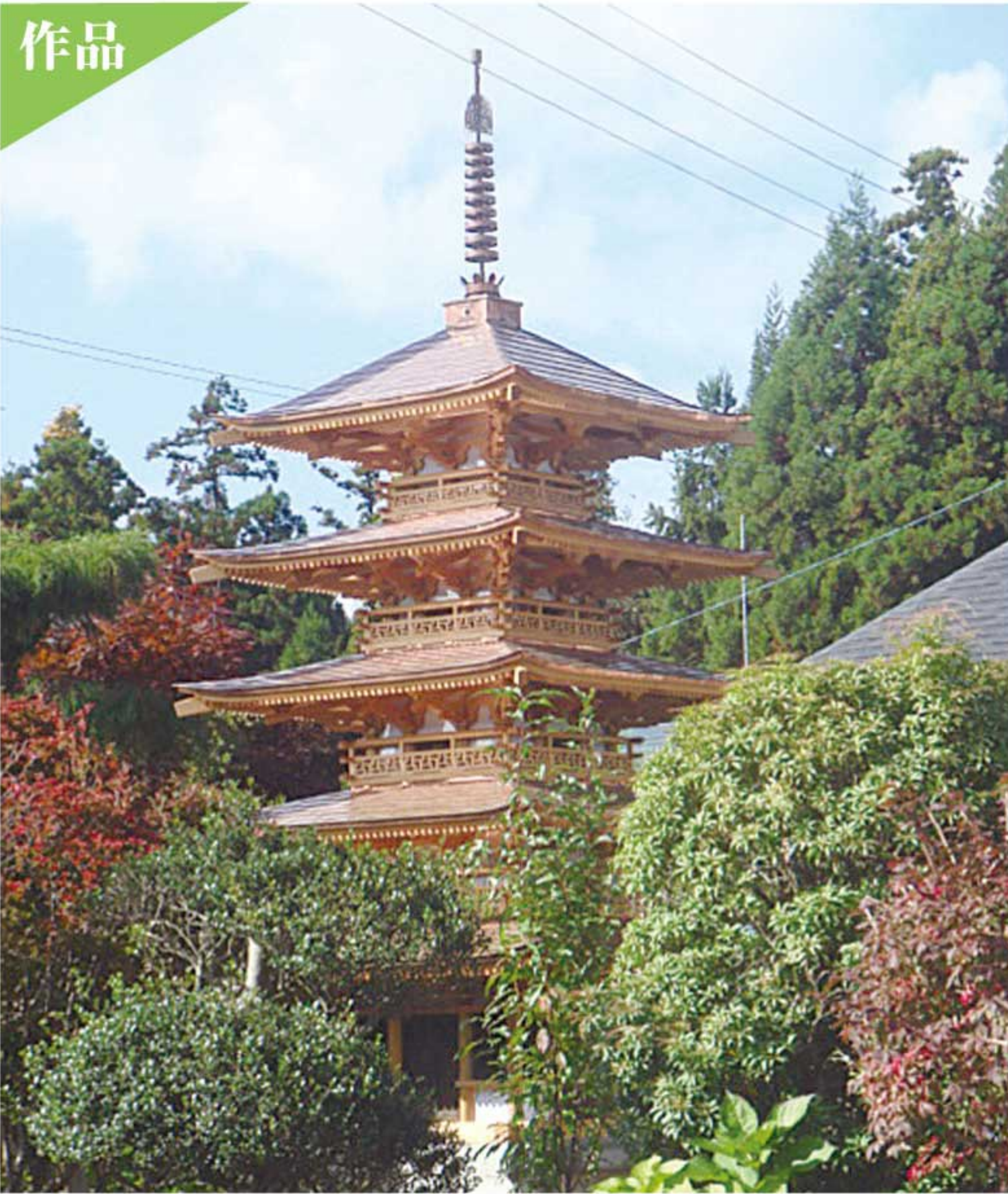
腕利きの職人は、銅板と木材を使って、すべて手作業でここまで出来ます(秋田市河辺岩見の五重塔)。