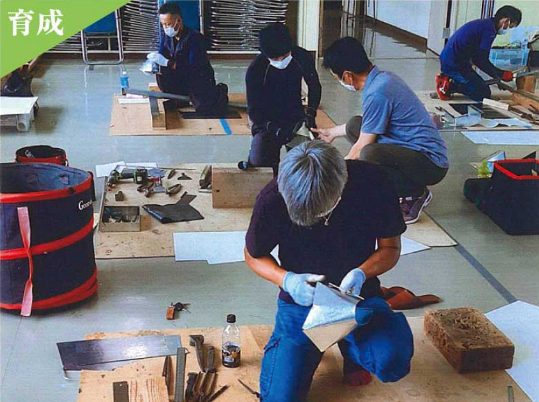
建築板金業者で構成する「秋田県板金工業組合秋田支部」では、意欲ある若い力が不安なく技術を磨いて成長できるよう、研修や競技会を積極的に行い、先輩の建築板金工が丁寧に指導し、業界ぐるみで大切に育てます。