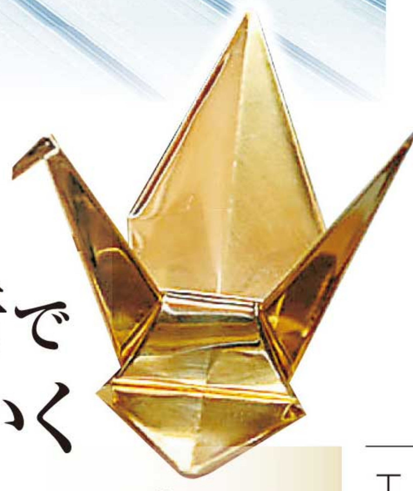
建築板金工が 作り上げた 板金の折り鶴