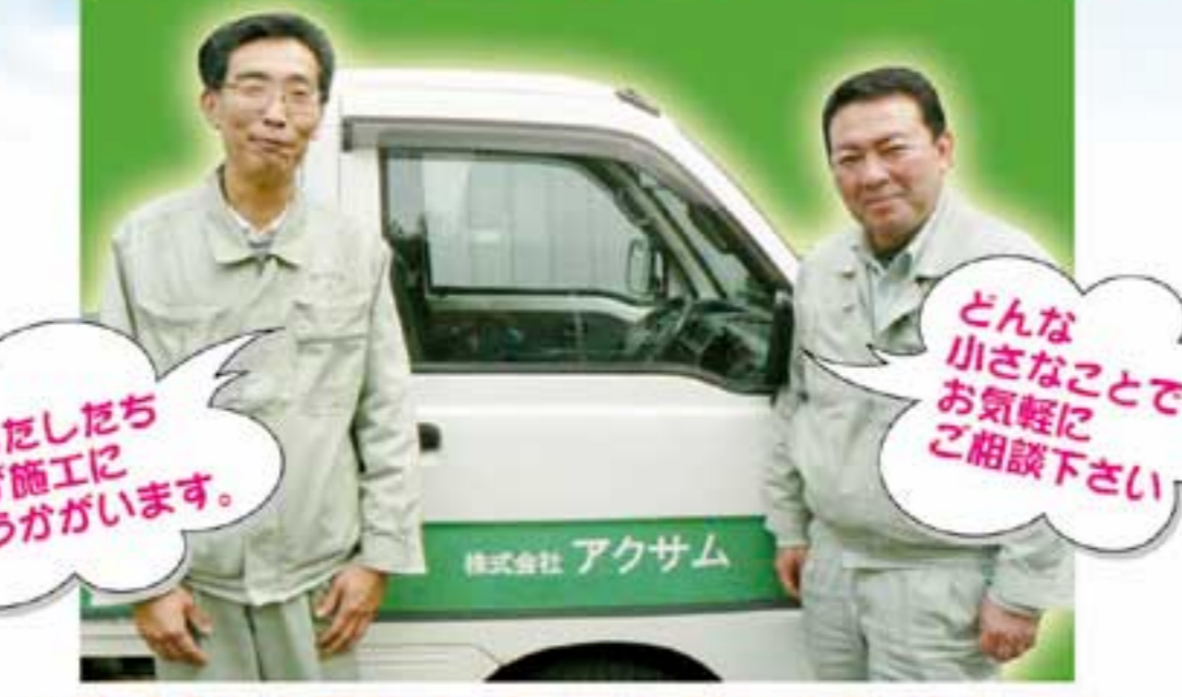
※助成金の申請等は、すべて無料で代行いたします。