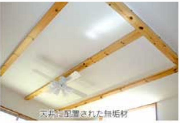
天井に配置された無垢材

新築建売でありながら、土地と建物に地盤改良費、外構工事費、消費税を含めても、一般的な中古住宅並みの価格帯。月々の返済額も、一般的な返済額よりも低めに設定されている。