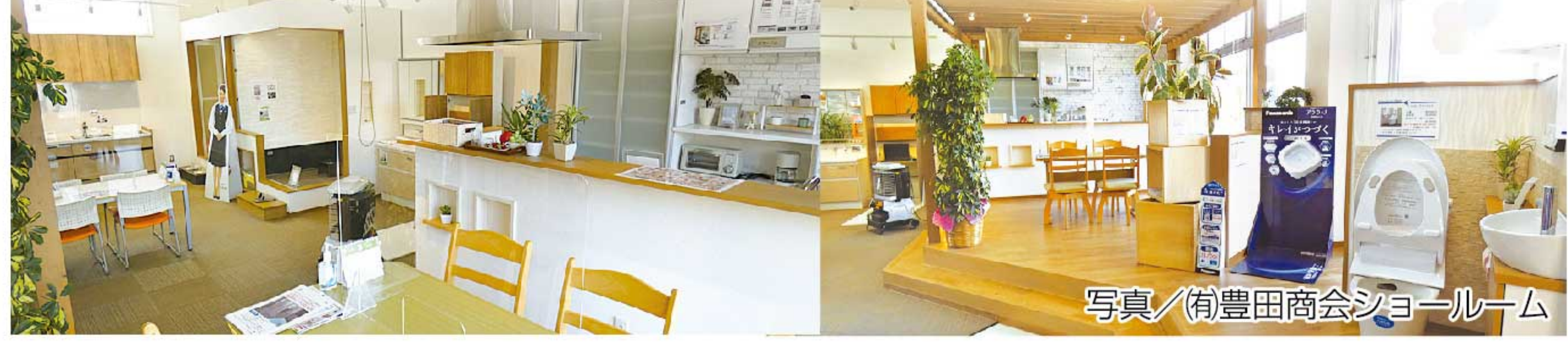
写真/有豊田商会ショールーム

リフォーム前には、ショールームの見学がおすすめです。商品の特徴や使い心地は、カタログやインターネット上の画像だけではわかりにくいからです。レイアウトを検討する際に役立ちます。リフォーム後に後悔しても、設備を取り替えるのは容易ではなく、費用もかかります。デザインや機能が気に入った商品があっても、実際に使ってみないと使い勝手が良いかわかりません。そのため、リフォーム前にショールームを見学し、実際に見たり、触ったりして商品を確認することが大事です。