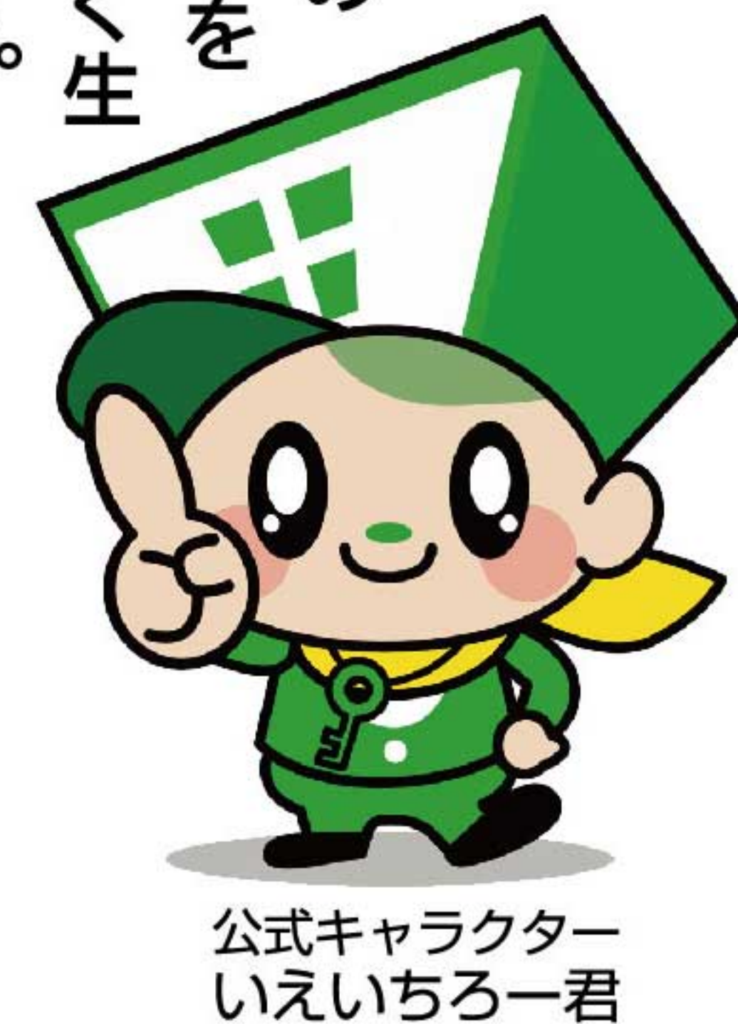
公式キャラクター いえいちるー君

牛島東リノベーションモデルハウス 近日完成・公開予定!! 「中古住宅を購入してリフォーム」というイメージが定着してきています。秋田市唯一の中古住宅専門店「いえいち」秋田市広面、横山金足線沿いは、そんな暮らし方の参考になるリノベーション住宅のモデルハウスを秋田市牛島東で建設中。築44年の住宅が真新しく生まれ変わって年明け2月に完成、公開が始まります。