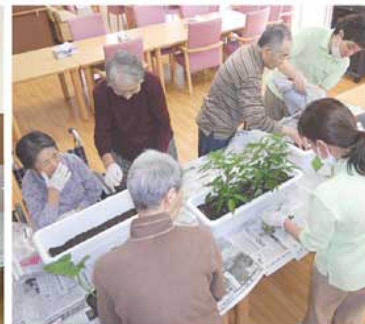
ミニトマト、ミニキュウリ、ピーマン、シシトウなどの夏野菜をプランターで栽培。収穫が待ち遠しい

人は誰でも老います。体が衰えると、それまでにできていたことが、だんだんできなくなってしまうたりします。でも、おいしいものを食べたり、仲間と笑いあひながら楽しい時間を過ごしたいという気持ちは、年齢を重ねても変わりません。ニチイケアセンターひろおもて秋田は、入居者のそうした思いに寄り添い、一人ひとりに応じた必要なサポートとサービスを行う暮らしの場です。