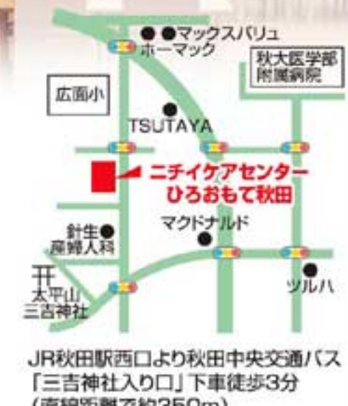
JR秋田駅西口より秋田中央交通バス「三吉神社入り口」下車徒歩3分(直線距離で約350m)

◎敷地面積/3,993.46㎡ ◎建物構造/鉄骨造地上2階建 ◎居室総数/60室(定員60名・全室完全個室制) ◎居室面積/11畳(18.00㎡~19.20㎡) ◎浴室/一般浴室4カ所、機械浴室2カ所 ◎居住の権利形態/利用権方式 ◎職員/25名(看護職員3名、介護職員22名) ◎協力医療機関/細谷病院、城東歯科クリニック