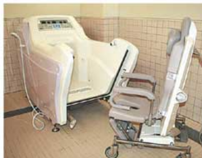
▲寝たきりの方や車いすの方が快適に入浴できる機械浴室が充実。上は、椅子に座ったまま浴槽と合体できる最新鋭タイプの浴槽 ▶右は、大きな窓から緑の木々を望む広い食堂

異業種から介護の世界に飛び込んで10年余。「お客様とのコミュニケーション」を一番大切にしています。駆け出しの頃、「この仕事は、お客様の命を預かる仕事なんだ」と先輩から教わりました。はじめは、技術的なことを覚えるので精いっぱいでしたが、だんだん慣れてくると、「命を預かる」ということの意味を考へるようになり、それが「お客様のための安全・安心をとことん追い求める」ことだと気がつきました。