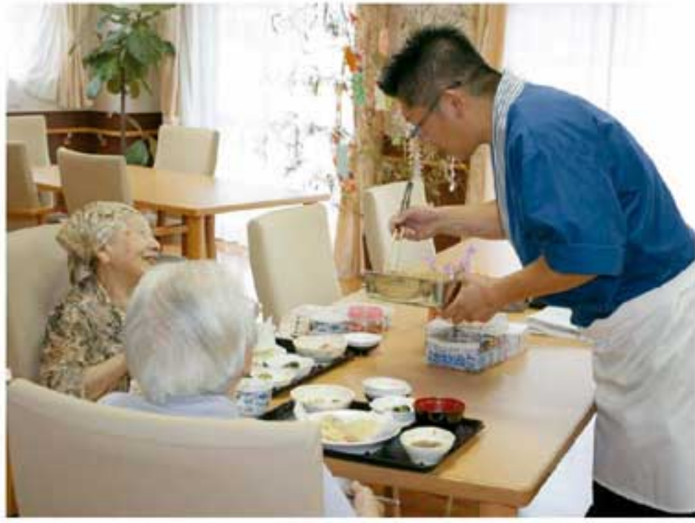
▲アツアツの天ぷらに箸が進む。「お代わり」をする人も。

パチパチと音を立てる天ぷら鍋、その脇に用意された新鮮なナス、シイタケ、キス、エビ。「さあ、次はお待ちかね、エビを揚げますよ。アツアツのうちにとくさくさ召し上がってくださいね」。1階の食堂に設置された屋台で、職人さんが元気の声で盛り上げながら、揚げたての天ぷらを手際よく大皿に盛り付けていく。