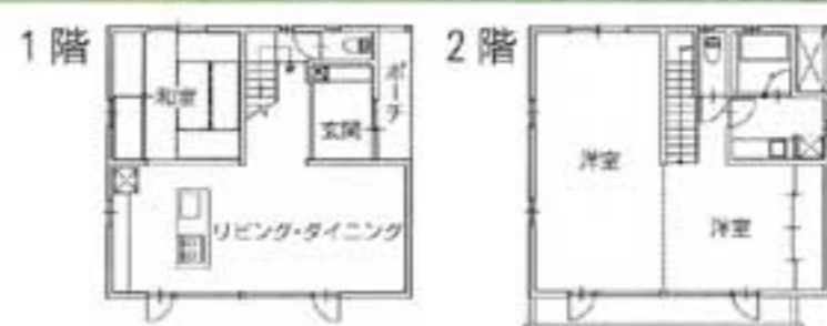
出居民家タイプ 42坪程度で坪53万円(税別)