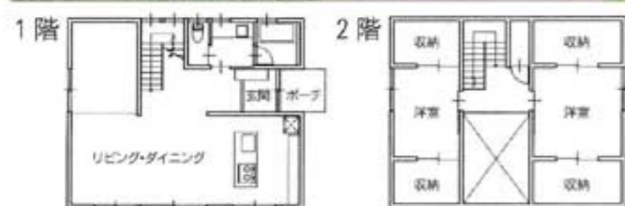
岩瀬牧場タイプ 42坪程度で坪50万円(税別)