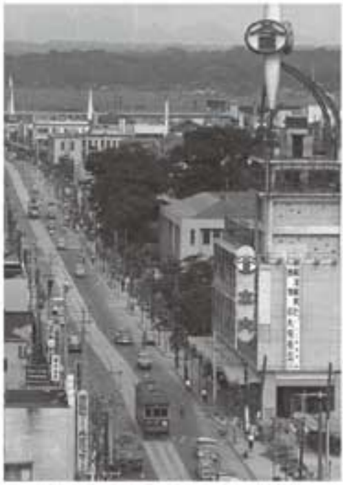
路面電車が走る広小路