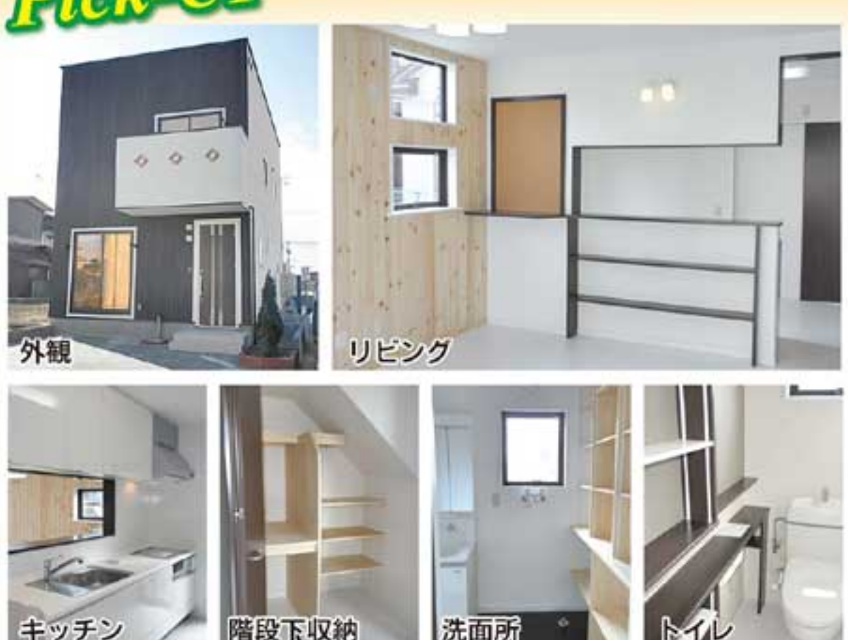
外観 リビング キッチン 階段下収納 洗面所 トイレ