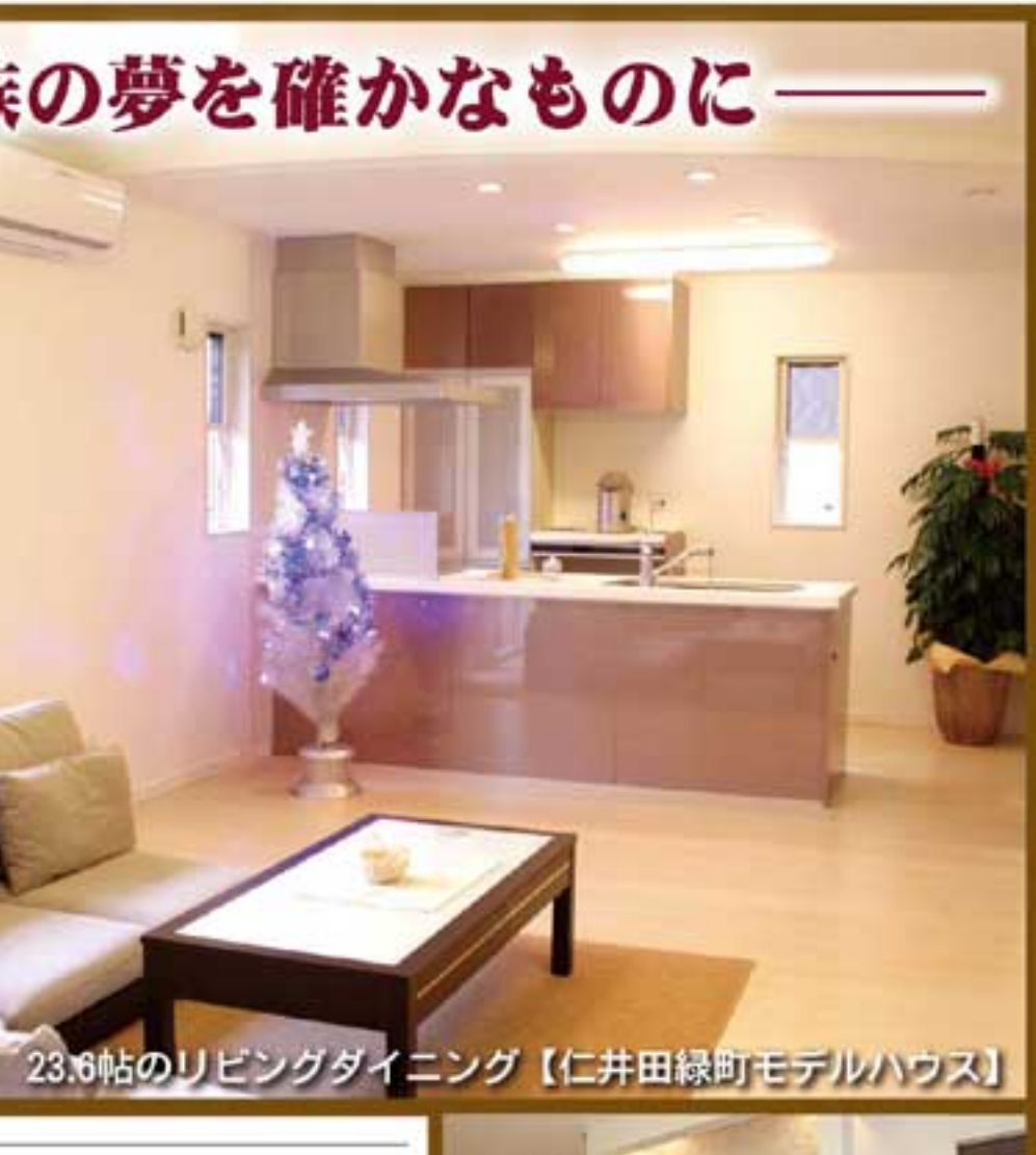
家族の夢を確かなものに —