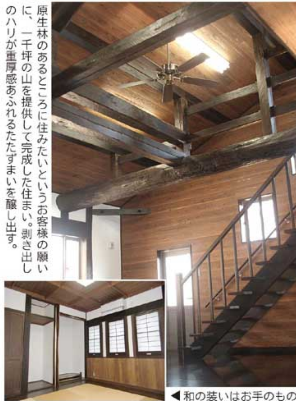
原生林のあるところに住みたいというお客様の願いに、一千坪の山を提供して完成した住まい。引き出しのハリが重厚感あふれるたたずまいを醸し出す。

株式会社 秋田建設工業新聞社 〒010-0951 秋田市山王6丁目8-42 Tel 018-863-4113 Fax 018-863-4319 URL http://www.akks.co.jp/ E-mail kadan@mailakks.co.jp