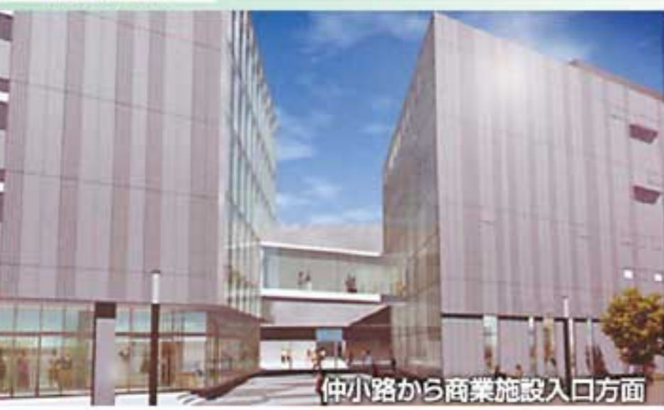
仲小路から商業施設入口方面

再開発で整備される各施設を紹介するシリーズ。今回は「商業施設・駐車場棟」のご紹介です。