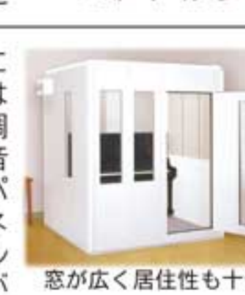
窓が広く居住性も十分に

には調音パネルが標準装備され、音響対策はバッチリ。調音パネルは、楽器に合わせて増やしたり減らしたり自由に調節もできます。