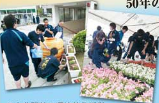
JR大曲駅前の環境美化活動

全日制課程は「進学文化」「スポーツ」の2コース制で、2年時からそれぞれ「教養」「情報」「福祉」の3系列を選択。多様な進路目標を実現するため、さまざまな資格取得にも挑戦している。