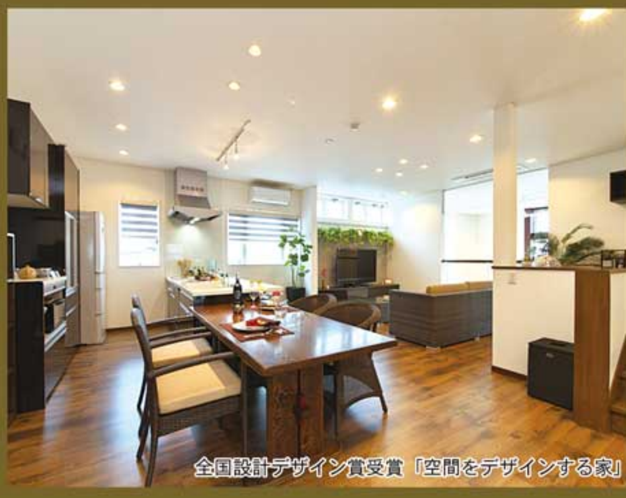
全国設計デザイン賞受賞「空間をデザインする家」

「エントランス&オープンカフェ」 エントランスをくぐると、大きな吹き抜けがこころよい、空間を驚かすに使用した開放的なオープンカフェがゲストをお迎え。オリジナルフレンドコ