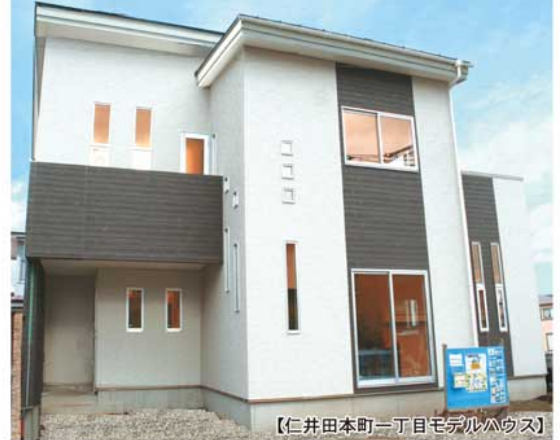
【仁井田本町一丁目モデルハウス】