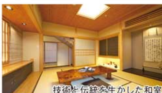
技術と伝統を生かした和室

また、地域の方々のコミュニケーションスペースとしても利用することが出来ます。あなたもホームページなどで情報をゲットして、出かけてみませんか。