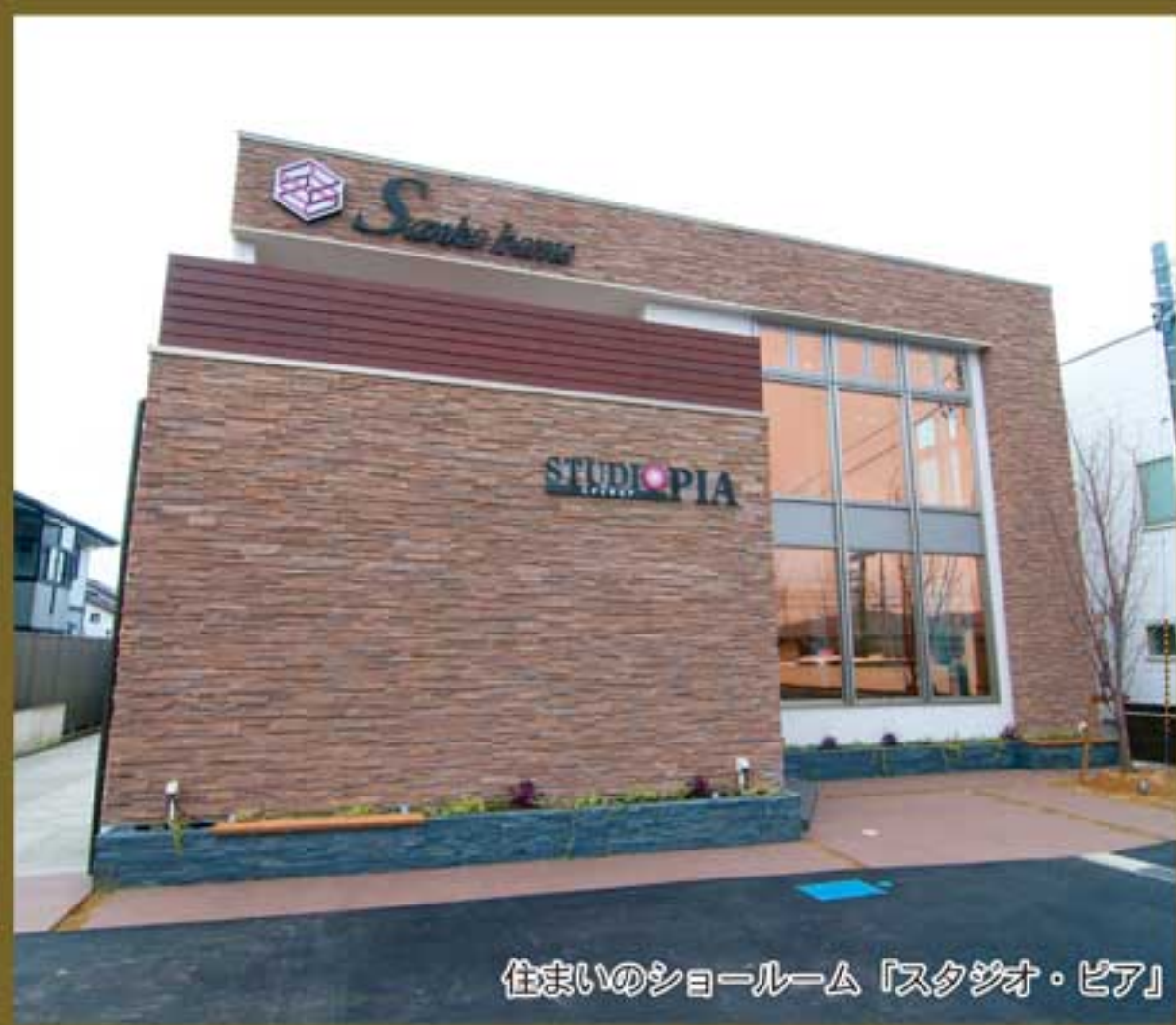
住まいのショールーム「スタジオ・ピア」