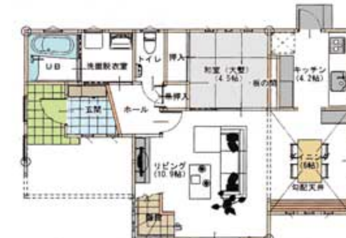
一階平面図 61.27㎡ (18.50坪)

所要所で少しずつ贅沢した仕上がり。濃淡のツートンカラーのモダンな外観は、板張りを思わせる濃い色の部分にアクセントとなり、縦につながる窓がとてもスタイリッシュ。ゆ