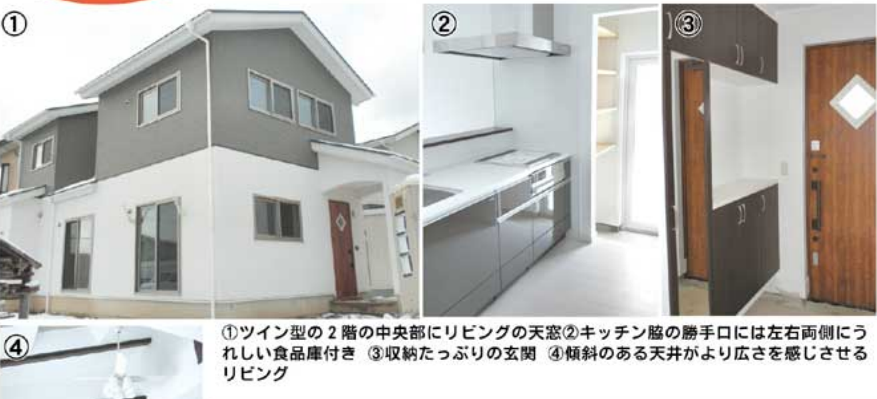
①ツイン型の2階の中央部にリビングの天窗②キッチン脇の勝手口には左右両側にうれしい食品庫付き ③収納たっぷりの玄関 ④傾斜のある天井がより広さを感じさせるリビング

若い世代でも、「土地探しからのマイホーム」は決して手の届かない夢ではない！リフォームキャップは、魅力ある新築住宅をリーズナブルな価格で提供し、たくさんの方々の夢の実現を支えている。今回ピックアップするのは、秋田市四ツ小屋の「グリンドピア四ツ小屋団地」内に完成した4LDKタイプの「四ツ小屋中野E棟」。1階リビングの天井に設けた天窗部分をアクセントに、その左右に2階部分を振り分けた「ツインタワー」型の造りが魅力的な1棟だ。