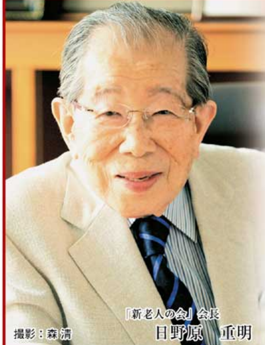
「新老人の会」会長 目野原 重明

「新老人の会」秋田支部は、会長 日野原 重明先生をお迎えし、「日野原 重明先生101歳記念講演会」を開催致します。 「新老人の会」は、日野原 重明先生が提唱された「新老人運動」に賛同する方々の集まりとして2000年に発足、全国の会員数は12,300名、42ヶ所に支部を設けるまでに成長いたしました。高齢になっても自立して、次の世代に「平和」と「いのち」の大切さを伝え、後に続く人のモデルとなることを目指して、世代を超えて共に学び合い支え合う生き方を追求しています。 この度、秋田支部設立を記念して、日野原 重明先生の講演と音楽の会を開催いたします。101歳になられてもお元気で、全国各地で精力的に講演活動を行っておられる日野原先生の心に響くメッセージをご期待ください。 多くの皆様のご参加をお待ちしております。