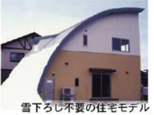
雪下ろし不要の住宅モデル

雪捨てによる外壁の劣化などを避けるため、家を高床式にする方法も。床下を倉庫や物置きとして活用でき便利ですが、玄関までの階段が高齢の方には負担ですので、対策が必要です。