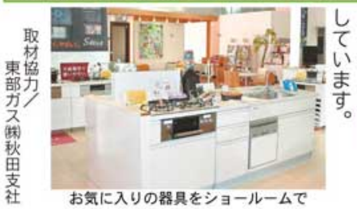
お気に入りの器具をショールームで