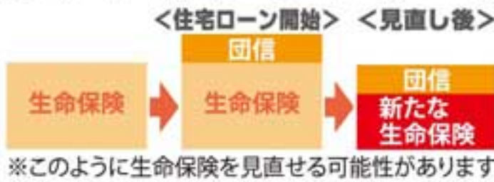
※このように生命保険を見直せる可能性があります

住宅ローンを組む際、ほとんどの場合、「団体信用生命保険(団信)」に加入します。「団信」は、万一死亡した場合、返済途中のローンを家族に残さず、残高を完済できる制度です。ここでチェックしたいのが、すでに加入している生命保険との重複です。