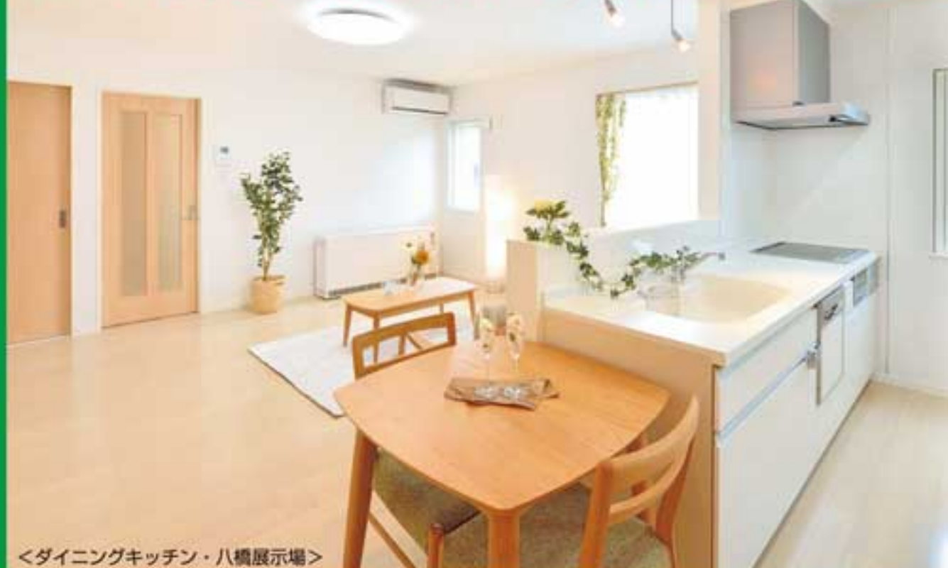
〈ダイニングキッチン・八橋展示場〉