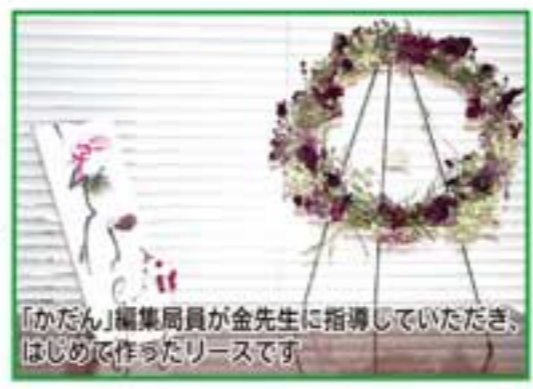
「かたん」編集部員が金先生に指導していただき、はじめて作ったリースです。

おしゃれに正月飾りを！ 一年中飾ることが出来る！ 【材料】 アケビのツル、シサル麻、金木樹、秋色みなずき、ニガイチゴの葉、野いばらの味、エクレールバラ、スプレーバラ 【準備するもの】 木工ボンド、はさみ、ワイヤー 【作り方】 ①リースをかけるためのフックを、リース台にワイヤーで巻きつけます。 ②アケビのリースを全面的にシサル麻をボンドでふわふわにつける。(以下素材はすべてボンドでつける)