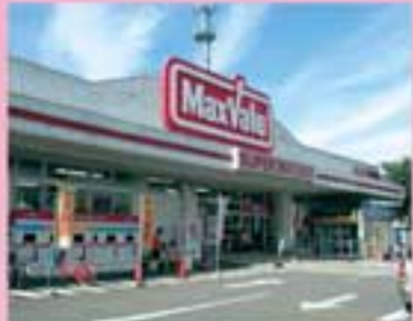
マックスバリュ広面店