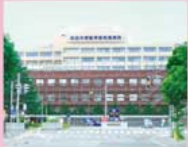
秋田大学医学部附属病院