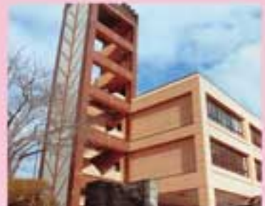
高校は秋田高校が徒歩圏内