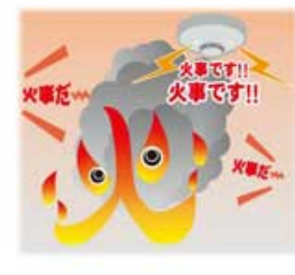
火事です!! 火事です!!

や厚手のビニールなどの中フタを利用すると、沸かすときのエネルギー量を減らし、省エネに繋がります。 ③時間を空けない お風呂にふたをしても、湯温は2時間程度で約1・5℃下がります。家族が続けて入浴すれば、沸かし直すロスがありません。 ④シャワーだけは止めよう 1人がシャワー使用時に使う水量は、なんと浴槽一杯分。複数の人が入浴する場合は浴槽入浴の方が断然おトクです。