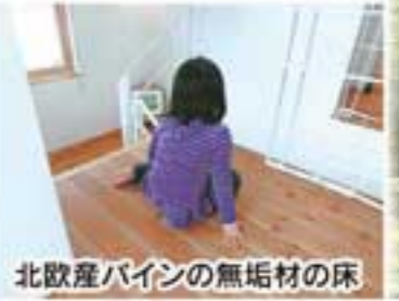
北歐産パインの無垢材の床

最近、健康を意識した住まいを求めるニーズが高まっています。心と身体で心地良さを感ずることができ「健康住宅」に欠かせない自然素材。その代表格「無垢の木」について紹介します。