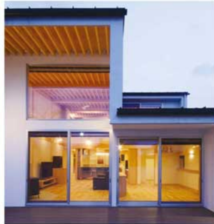
安達揚一氏/新ストープのあるコートハウス

ASJは、日本全国で活躍する建築家ネットワークを持つ建設会社と提携して各地に、土地探し、資金