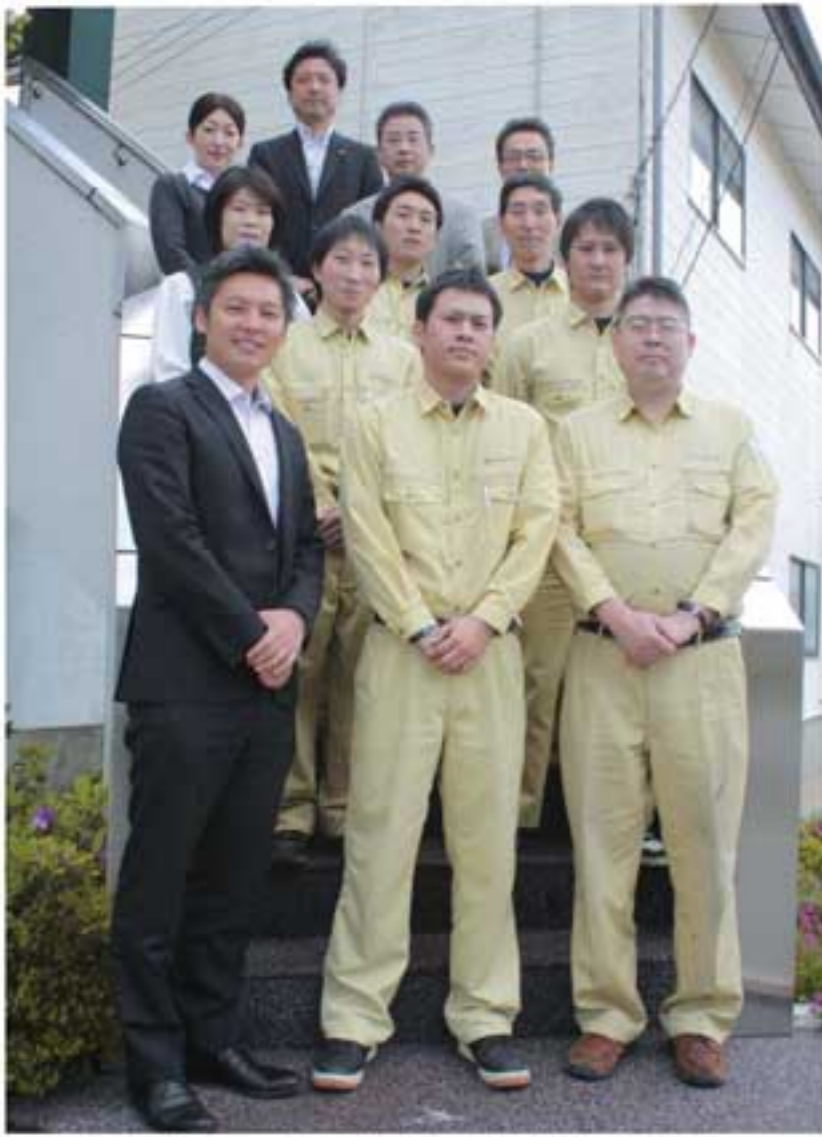
スペシャリスト集団が対応します