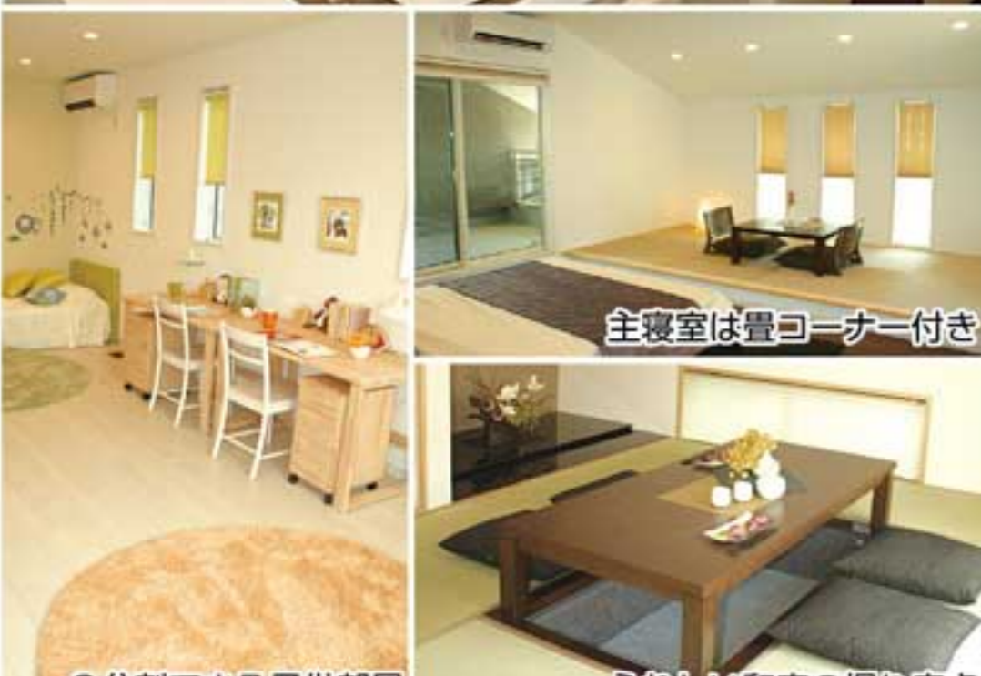
主寝室は畳コーナー付き