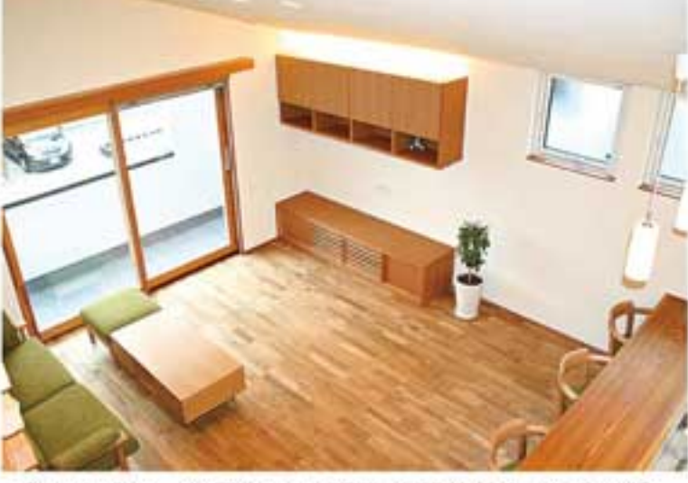
プライバシーを保ちつつ明るく開放的なリビング

床暖房に対応したナラ無垢材の床は浮き目模様が美しく、足の裏にも心地良い。照明には間接照明を交え、上質の明るさを演出している。