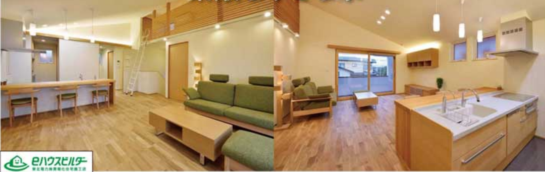
■一級建築士事務所／秋田県知事登録02-04A-0140 ■建設許可／秋田県知事(般-24-40068号) ■宅地建物取引業免許／秋田県知事(1)第2139号