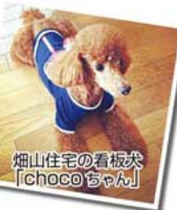
畑山住宅の看板犬「chocoちゃん」