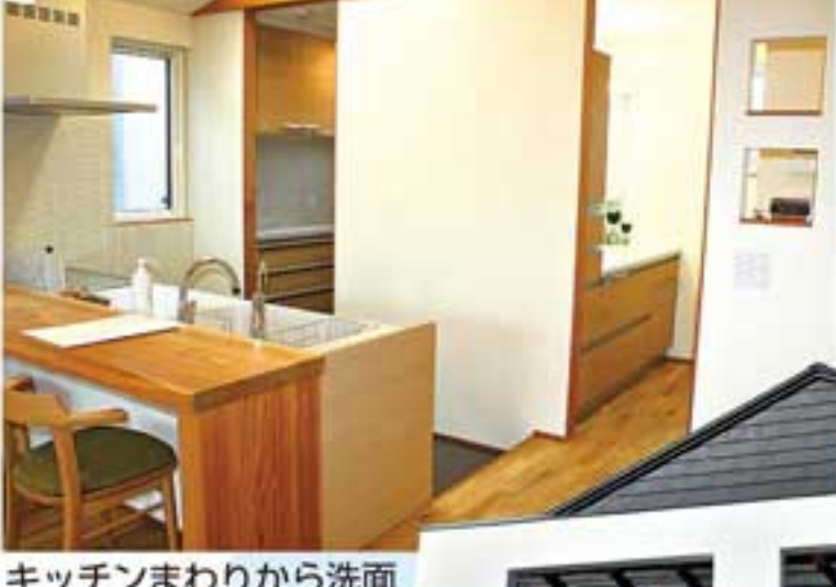
キッチンまわりから洗面にアクセスする動線