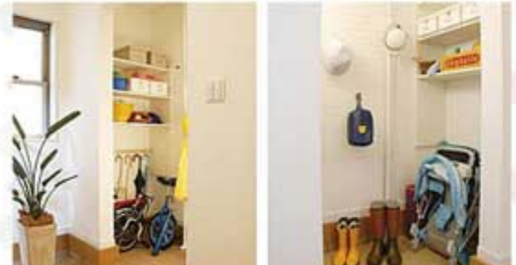
ベビーカー、玩具などを保管する玄関収納