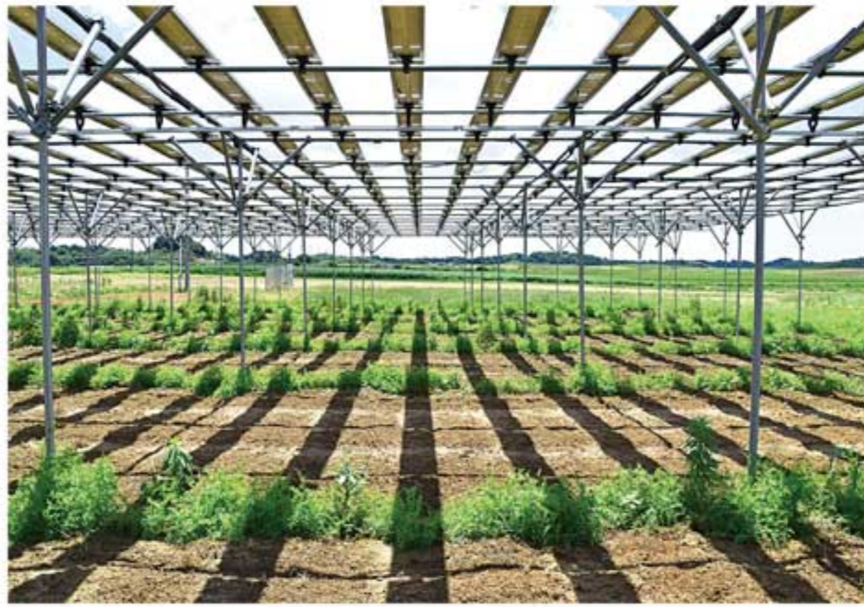
ソーラーシェアリングは、農地の空中に隙間を作ってソーラーパネルを並べ、農作物の生育に必要な日射量を確保しながら発電します

作った電気でも売電収入 ソーラーシェアリングは、田んぼや畑地などの農地に支柱を立てて太陽光パネルを設置し、農業と発電事業を同時に行うこと。農地を発電目的のみで使うのではなく、農作物を育てながら発電も行うことから「営農型発電」とも呼ばれます。 例えば出力50kWのソーラーパネル