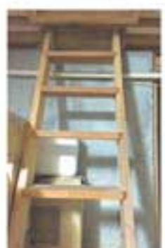
リビングから床下へ