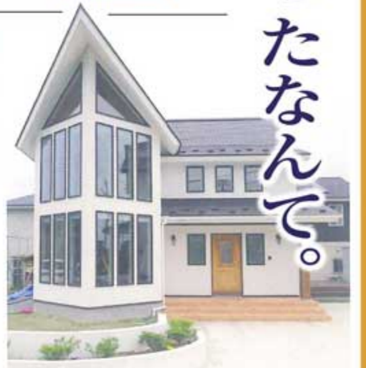
常設モデルハウス「グラーツ」 秋田市御所野地蔵田5丁目22-20