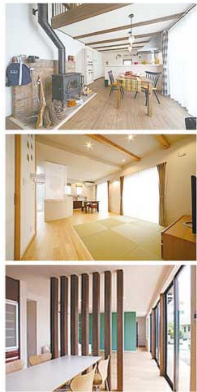
ドアは、天井まですっきりと納まる「フルハイトドア」でスタイリッシュな空間を演出

「和モダン」スタイルをベースにエコ住宅を追求して実績を築く小坂ハウス工業が、新ブランド「Life Box (ライフボックス)」を立ち上げた。「住まいをカスタマイズする」という新発想から生まれたLife Boxは、徹底して無駄をそぎ落としたシンプルで機能美が特徴。明快な設計基準で価格を抑えた4パターンのモデルプランで提案する。